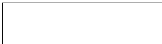
Рисунок 1 – Текст

Текст. Текст. Текст. Текст. Текст. Текст. Текст. Текст. Текст. Текст. Текст. Текст. Текст. Текст. Текст. Текст. Текст. Текст. Текст. Текст. Текст. Текст. Текст. Текст. Текст. Текст. Текст. Текст. Текст.