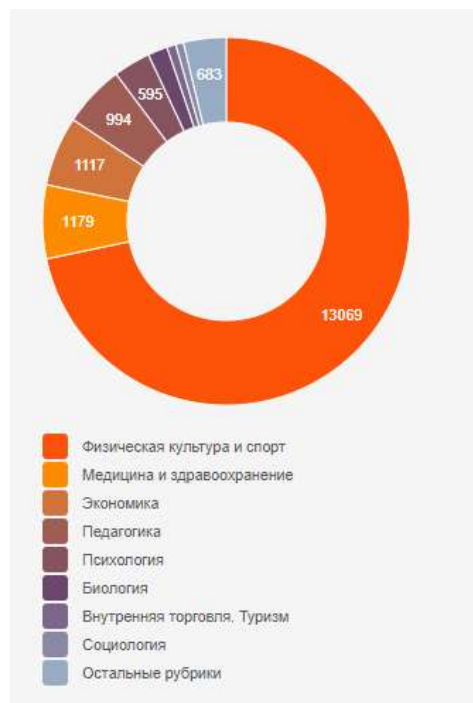
по научным направлениям