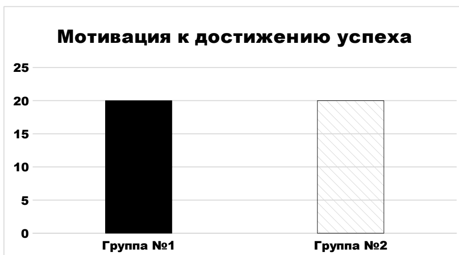
Рисунок 8 – средние значения мотивации к достижению успеха у Группы №1 и Группы №2, выявленные при помощи методики Т. Элерса

На рисунке 8 показано, что полученные в ходе диагностики значения у Группы №1 и Группы №2 находятся на одном уровне и соответствуют высокому уровню мотивации к достижению успеха.