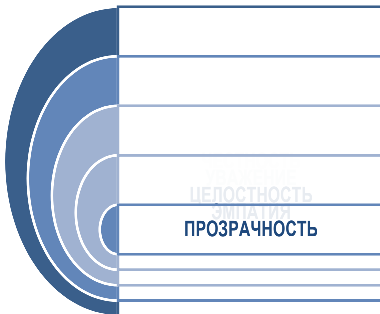
Рис 40. Пять универсальных принципов фандрайзера

Честность: фандрайзеры в любое время будут действовать честно и правдиво для сохранения общественного доверия и не введение доноров и клиентов в заблуждение.